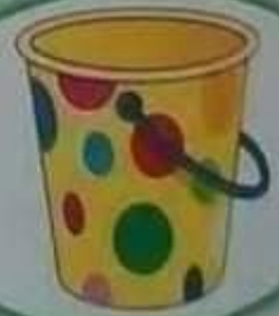
Pail دلو (جردل)