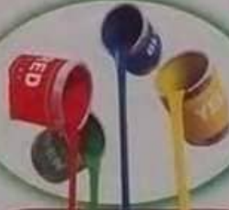
Paint طلاء (بوية)