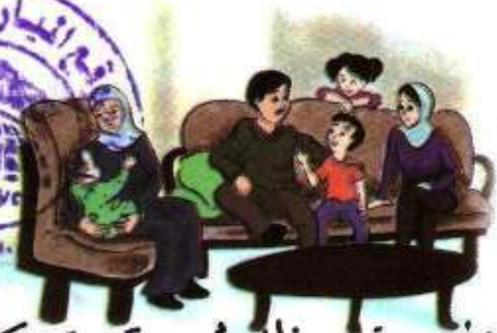
الْعَيْشِ فِي ظِلِّ أَسْرَةٍ مَتَمَسِّكَةٍ