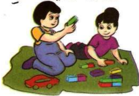
حَقِّي فِي إِمْقَابِرِ عَنِ الْفَنَنِ بِاللَّعِبِ