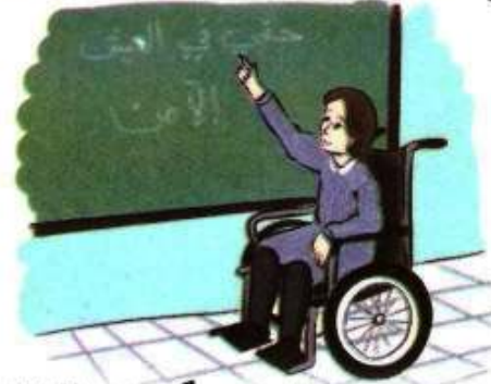
حَقِّي فِي الْعَيْشِ الْأَمِينِ وَالْعَلِيمِ نُعَبِّرُ عَمَّا نَشَاهِدُهُ فِي الرُّسُومَاتِ.