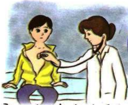
حَقِّي فِي الرِّعَايَةِ الصَّحِيَّةِ