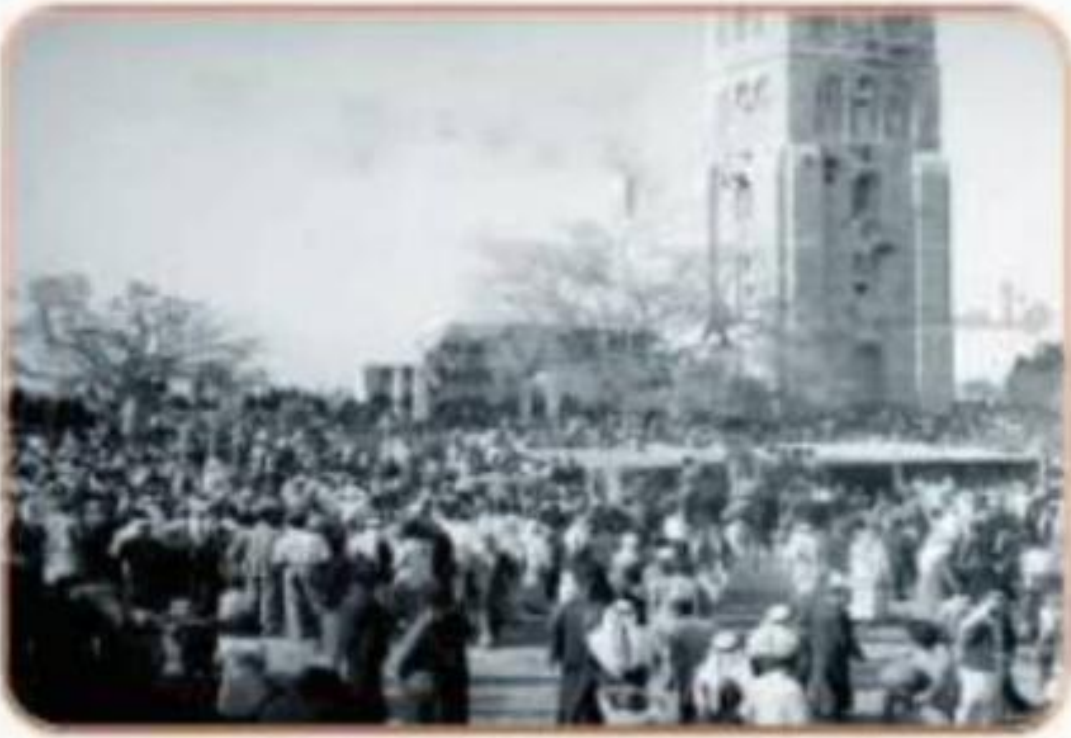
الرملة.. ومنازلها.. وأهلها - سنة ١٩٤٣م

بنى سليمان بن عبد الملك مدينة الرملة أثناء ولايته على فلسطين في خلافة أخيه الوليد بن عبد الملك، وقد اختلفت الروايات في سبب التسمية، ودوافع البناء، لكن الراجح أن الاسم جاء من الرمال التي تحيط بالمدينة، وأنها سميت رملة في البداية، أما دوافع البناء، فتعود إلى الاحتكاك اليومي بين الجنود والسكان المحليين في مدينة اللد لذا فضل سليمان إخراج جنوده من المدينة إلى منطقة الرملة خاصة؛ لأنه كان يميل إلى الهدوء بعيداً عن الضجيج اليومي الذي انتشر في مدينة اللد.